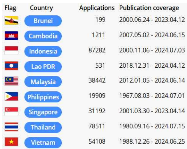
図2. ASEAN 各国意匠収録概要

図1右上の「Designs」をクリックすると ASEAN 9 か国全体を横断検索できる意匠検索画面が開きます。検索と表示は基本的には商標検索と同様です。現時点（2024 年 7 月末）の各国収録数と収録期間が図2のように示されています。