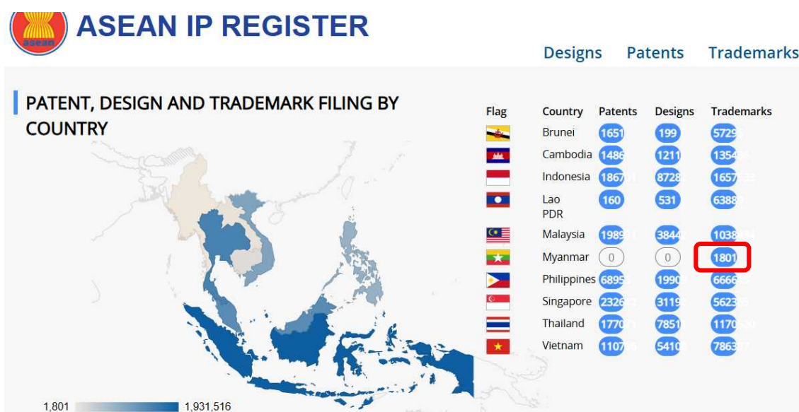
図 1. ASEAN IP REGISTER の入口

ASEAN TMview と共に少々使いづらい点もありましたが、分類や出願人などの統計解析を自動で解析してくれる点では有用でした。いずれにしても ASEAN の情報からは今後も目が離せません。