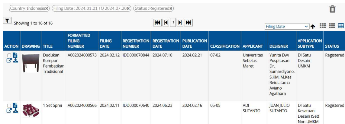
図 5. 検索結果一覧