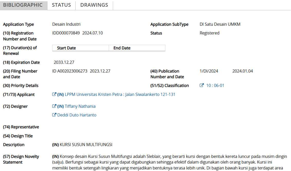
図 6 . 詳細表示